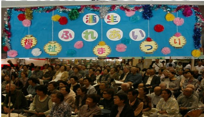
皆様の元氣と笑顔いっぱいの会場