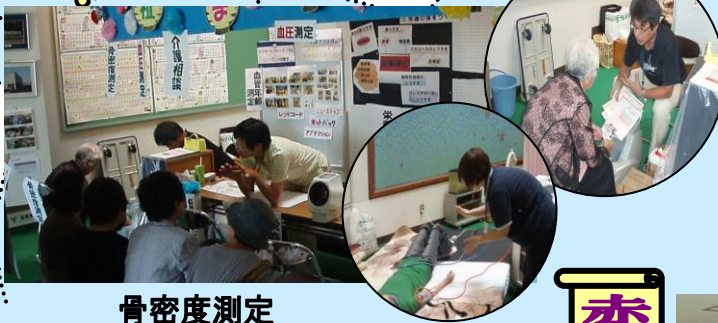
骨密度測定 血管年齢測定など 大好評でした。