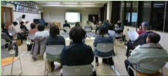
新型コロナウイルスの感染や対応策について 専門医師のお話を真剣に受け止め、不安が少し減った？