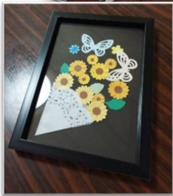
クラフトパンチの壁掛け作り