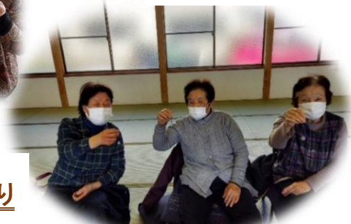
プラスチック粘土のストラップ作り