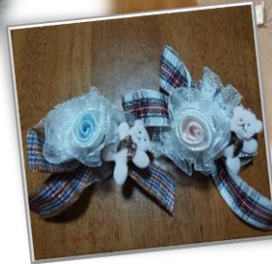
コサージュ作って