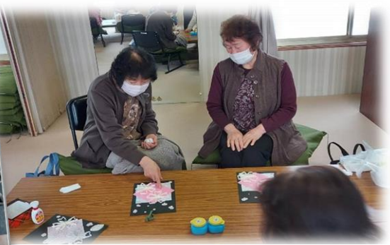
トイレトペーパーの芯で桜が咲いたよ